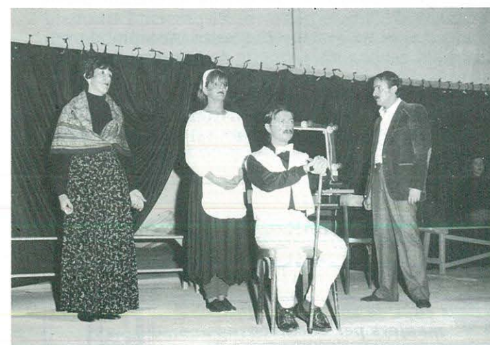
"Magazine" Grup Hidra de Terrassa

El C.C.R. va presentar "La torre i el galliner" de Vittorio Calvino, una obra que l'any 1.962, ja es va representar amb un plantejament prou diferent. L'ocasió d'ara ha servit també per a invitar a la funció del passat dia 18 de novembre als ex-actors que fa vint-i-vuit anys van intervenir en aquesta obra.