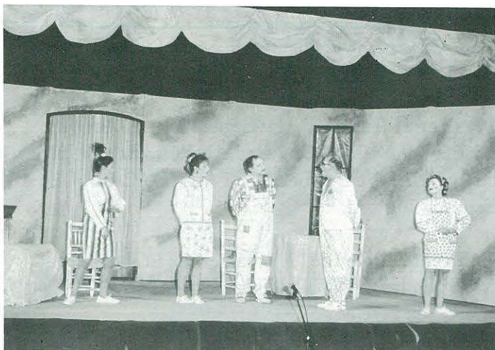
"La torre i el galliner" Centre Cultural i Recreatiu