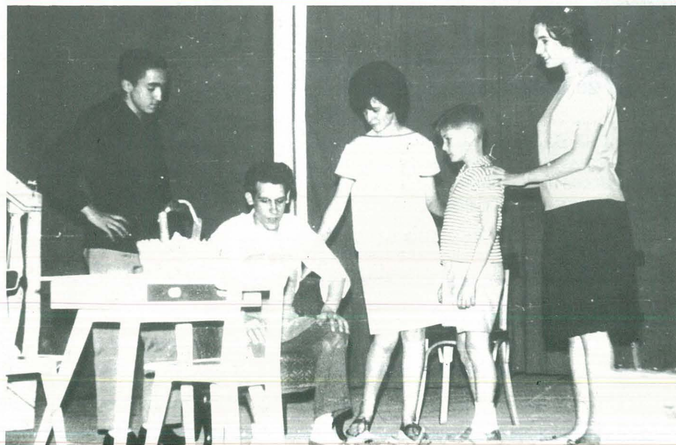
"LA TORRE SOBRE EL GALLINERO" - 1.962