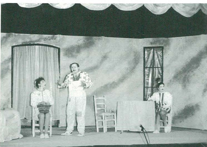
"La torre i el galliner" Centre Cultural i Recreatiu