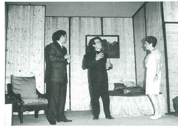
"4 nits de nuvis de 3" Cabós Teatre de Lleida