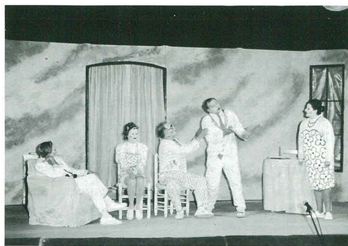
"La torre i el galliner" Centre Cultural i Recreatiu