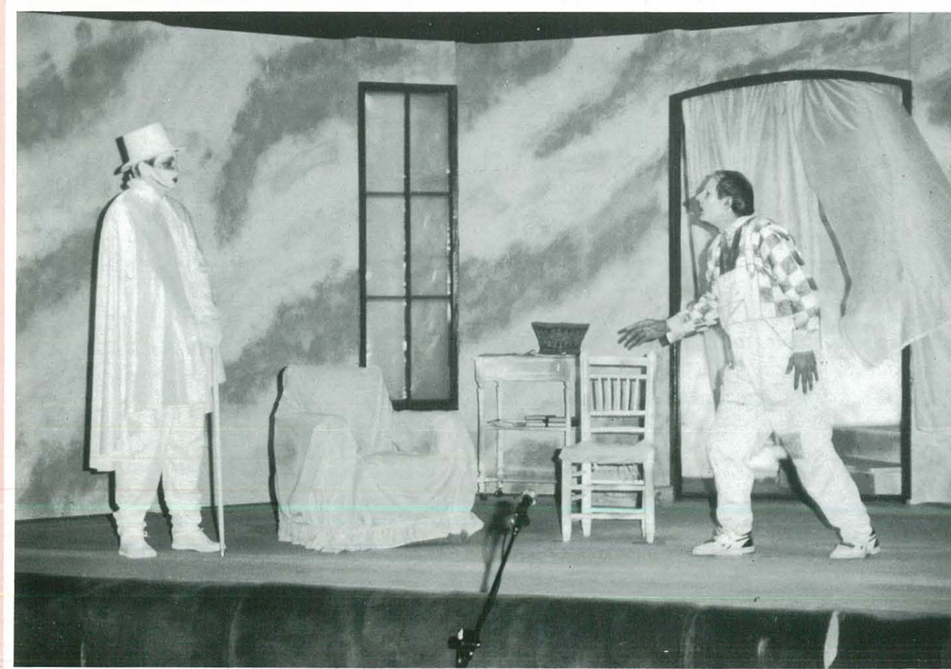
"LA TORRE I EL GALLINER" - 1.990