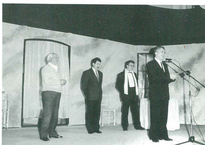
Cloenda de les VIII Jornades de Teatre