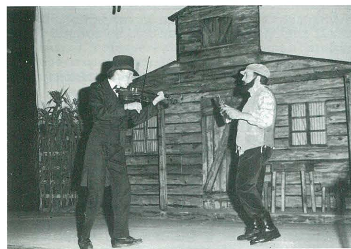
"Tevye, el jueu" Grup Teatral de Capellades