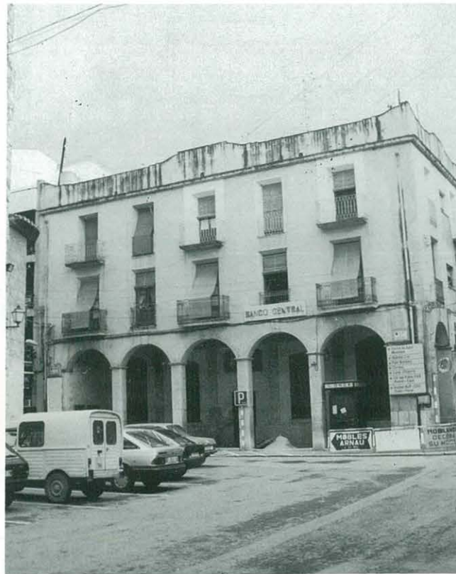
"Plaça Major" - Any 1990. - Lloc on ara fa un segle era enclavada la Torre i l'antic Ajuntament

ELS FETS ES PRECIPITEN RÀPIDAMENT. - Després de sis mesos de paralització total del projecte d'enderrocament (del 24 de maig al 22 de Novembre 1.890) es reaviva l'expedient i de manera ràpida i precipitada i es passa a l'acció de la infamant demolició de la torre. Anem a seguir de manera cronològica la precipitació dels fets: