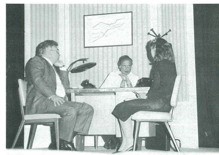
"Quan els núvols canvien de nas" La Teatral de Barcelona