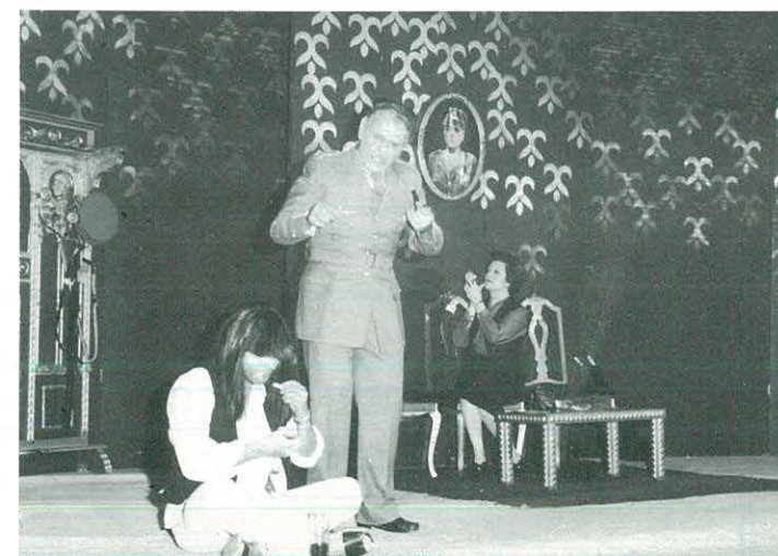
"El general torna a casa" Grup Scena de Sabadell