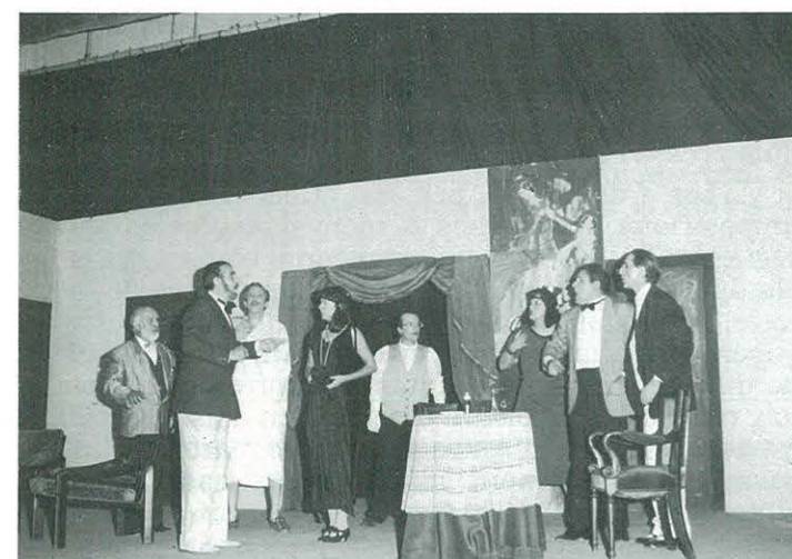
"L'hotel dels gemecs" Grup Escènic de Navàs